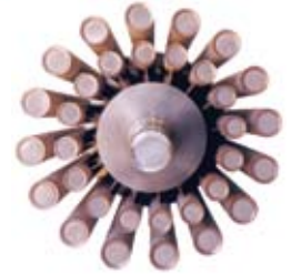
Vista traseira do eixo tubular do Supercookor.