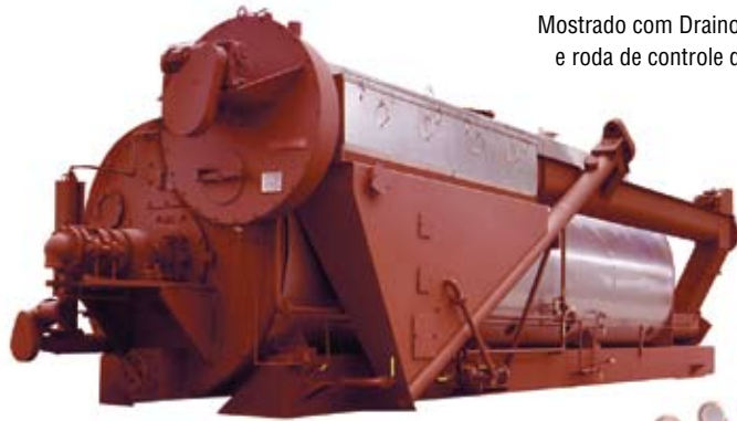
Mostrado com Drainer, Sedimentor e roda de controle de descarga.

Até 4,400 pés quadrados de superfície de troca térmica.